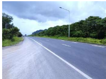
ทางหลวงหมายเลข 44