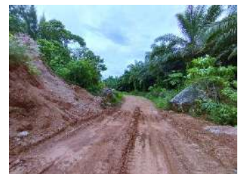
พื้นที่เว้นการทำเหมือง