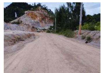
เส้นทางขนส่งแร่