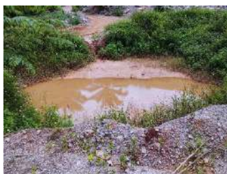
บ่อดักตะกอน